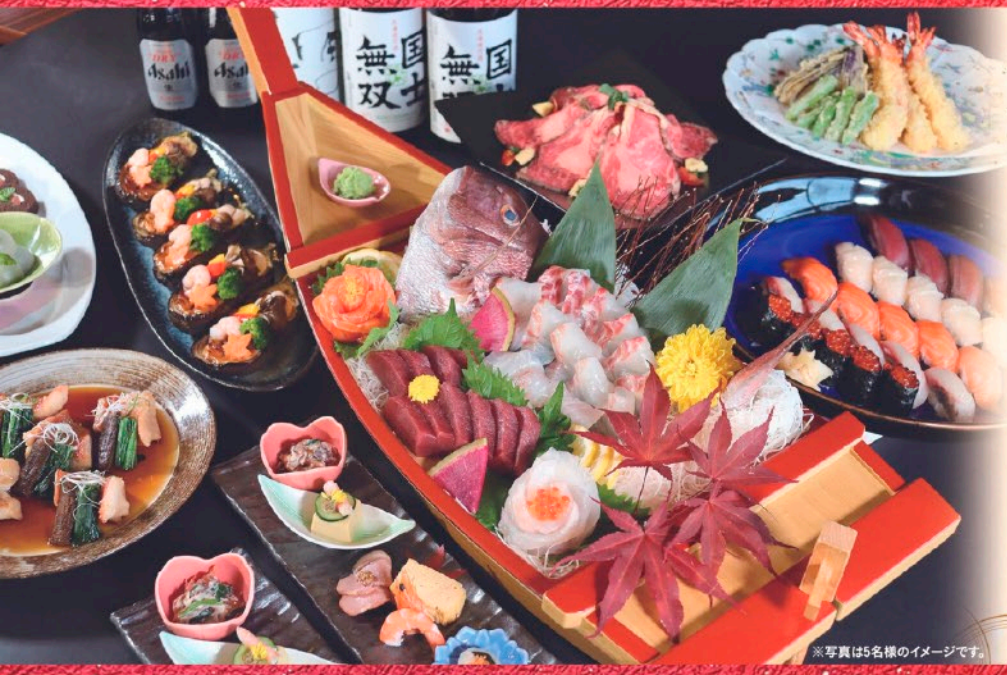
※写真は5名様イメージです。