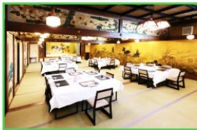
桐こぶし・松の間