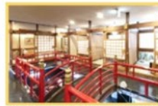
1階 小上がり・太鼓橋 *鯉が楽しめます