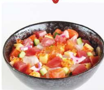
選べる丼・そばセット