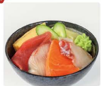
選べる丼・そばセット