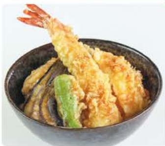
選べる丼・そばセット