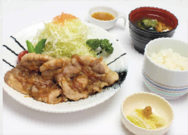
生姜焼き定食 (ランチ限定価格) 1,300円(税込1,430円)