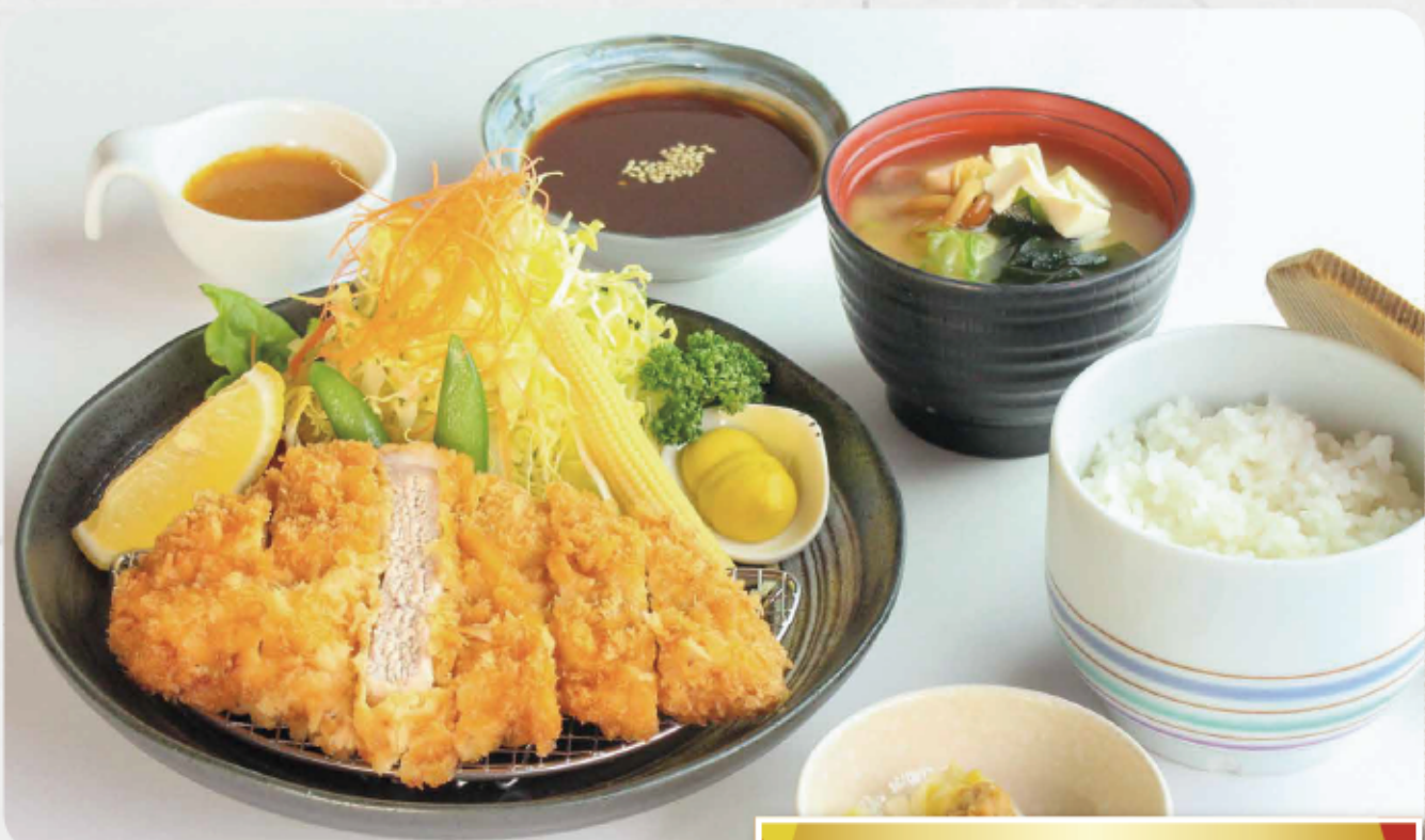
とんかつ定食 (ランチ限定価格) 1,400円(税込1,540円)