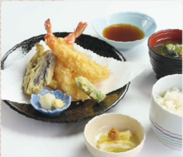
天ぷら定食 (ランチ限定価格) 1,500円(税込1,650円)